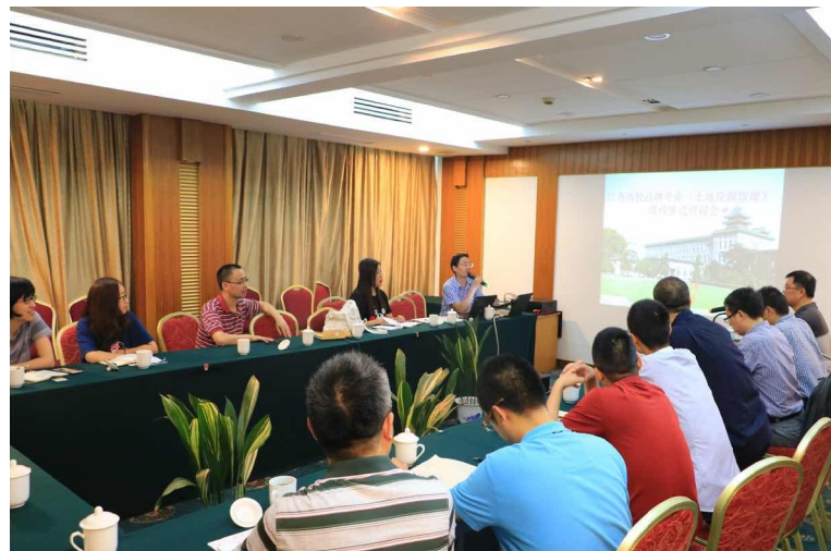
图10 土地资源管理专业老师进行品牌专业建设研讨

土地资源管理专业部分老师出席夏令营活动，对来自全国各高校的土地资源管理专业学生进行指导，并在开营期间，于武进市就土地资源管理品牌专业建设中的相关问题进行深入研讨。