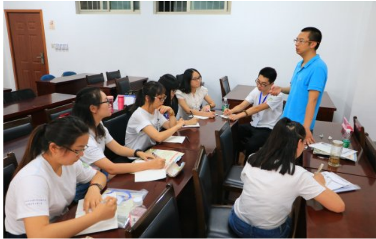
图9 师生交流调研心得

土地资源管理专业部分老师出席夏令营活动，对来自全国各高校的土地资源管理专业学生进行指导，并在开营期间，于武进市就土地资源管理品牌专业建设中的相关问题进行深入研讨。