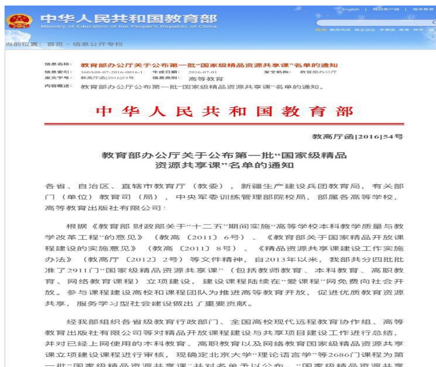
图 3 教育部办公厅关于公布第一批“国家级精品资源共享课”名单的通知

精品资源共享课是以高校教师和大学生为服务主体，同时面向社会学习者的基础课和专业课等各类网络共享课程。精品资源共享课旨在推动高等学校优质课程教学资源共建共享，着力促进教育教学观念转变、教学内容更新和教学方法改革，提高人才培养质量，服务学习型社会建设。在教育部公布第一批“国家级精品资源共享课”名单里，我校《不动产估价》和《土地经济学》光荣上榜。