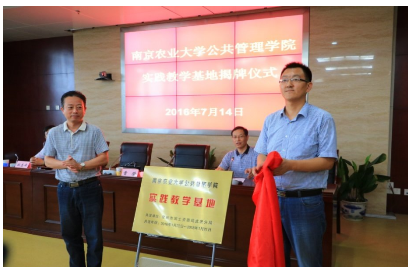
图 5 “南京农业大学公共管理学院实践教学基地”揭牌

2016 年 7 月 14 日，南京农业大学公共管理学院在常州武进举行实践教学基地和农村土地制度改革固定观察点的揭牌仪式。