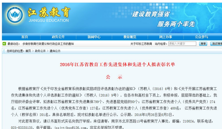
图 2 2016 年江苏省教育厅先进集体和先进个人表彰名单公示