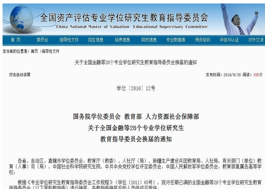
图 1 第四届全国公共管理专业学位研究生教育指导委员会委员换届公示

据悉此次全国公共管理专业学位研究生教育指导委员会委员换届于今年 6 月份进行，共聘任主任委员 1 人、副主任委员 4 人、委员 21 人，我院石晓平教授是本届 26 位委员中唯一的江苏省委员，负责联系江苏省 17 所 MPA 培养高校。