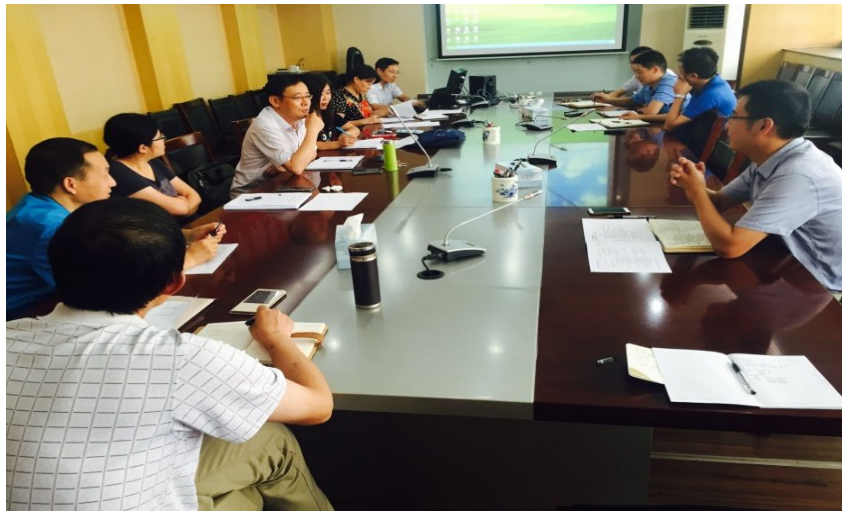
图 4 新学期土地资源管理品牌专业建设推进会

费使用情况作了详细汇报。针对“江苏高校品牌建设工程一期项目立项专业项目任务书”中承诺的具体成果，各位老师共同梳理六大板块任务的完成进度。